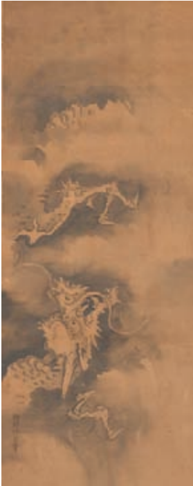
蘇東坡に龍図 狩野休田清信 江戸時代 本紙82.7×33.2cm 絹本墨画淡彩 三幅対