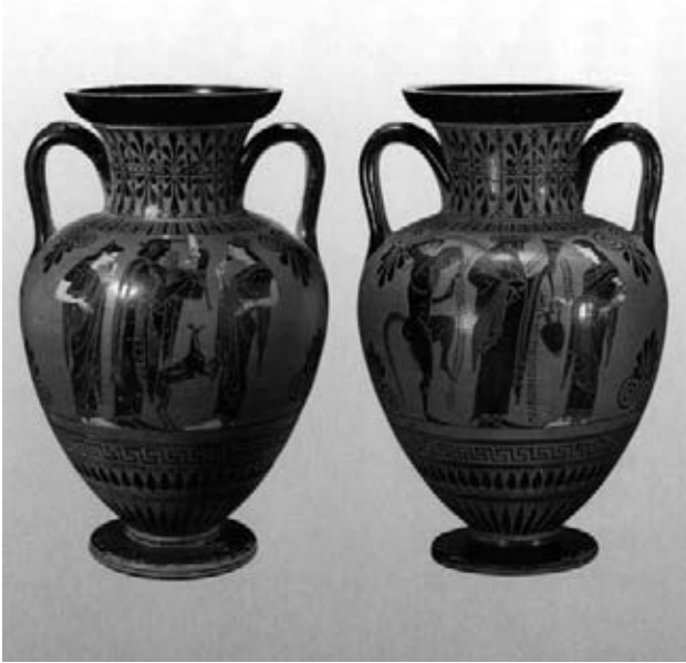
アンフォラ (壺) ギリシャ・ローマ文明 紀元前6世紀末 イタリア H 41 cm 平山郁夫シルクロード美術館

今日のグローバル化した世界の中で、私たちが世界を見る眼の基礎となり、世界で起こっている様々な出来事を深くバランスよく理解し、私たちの社会の将来性を定めるために歴史に学ぶことは必要不可欠だと思います。