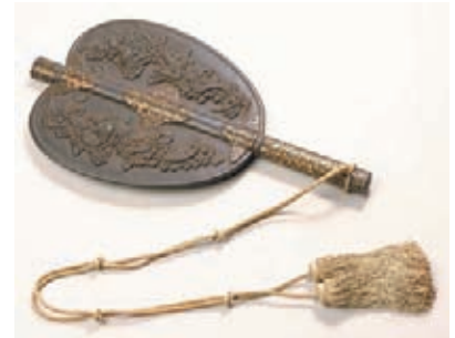
雲龍日月図軍配 40.0×22.0cm 鑄物