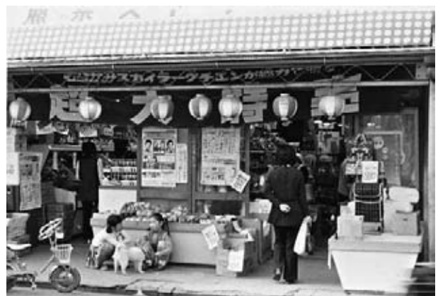
石巻谷町スーパーマーケット店頭 昭和40年代