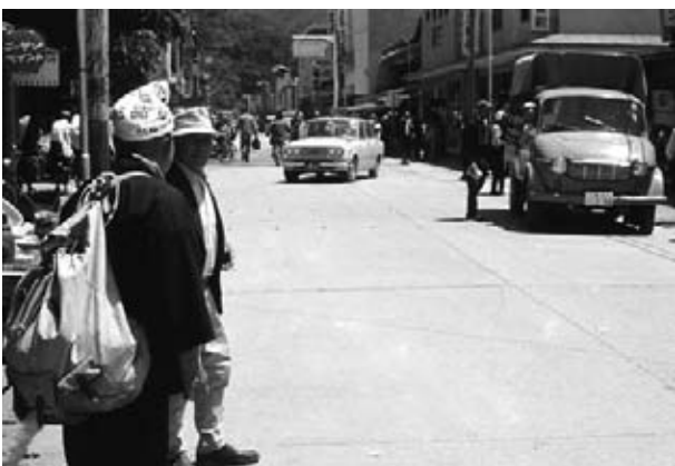
大迫町 市日の風景 昭和40年代

今回ご紹介できなかった写真は、まだまだたくさんあります。薄っすらとほこりを被った記憶によってインスパイアされるこの企画を今後も続けて行きたいと思っています。