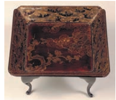
黒漆地梅に龍沈金菓子盆 江戸時代中期 24.0×23.6×13.0cm 盆深3.5cm 黒漆地・木製

2012年は神話上の動物である「竜・龍」が割り当てられた辰年。中国では神秘的な存在に位置づけられており、また日本にも様々な「竜・龍」の伝説や言い伝えが存在します。