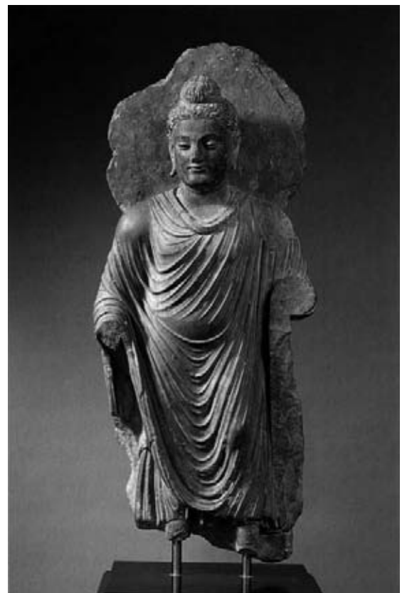
仏陀立像 シルクロード文明 2～3世紀 ガンダーラ (パキスタン) H 94 cm 平山郁夫シルクロード美術館